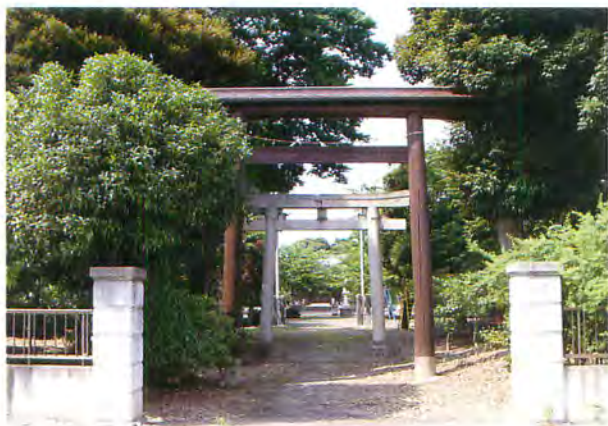
神明社(大杉神社合祀)

葛和田河岸は、『新編武蔵風土記稿』に「寛永（一六二四）の頃より江戸運送の河岸場あり」とあり、元禄三年（一六九〇）に幕府が実施した河岸の調査『関八州伊豆駿河国廻米津出湊浦々河岸之道法并運賃書付』にも名を連ねています。陸上輸送を人力と馬に頼っていた時代にあつて、利根川の水運は、江戸と各地を結ぶ大動脈として発展し、荷の集積地であつた河岸には、高瀬船（大型の帆船）などが出入りして大変賑わいました。しかし、近代に入り、鉄道網や道路など、陸上交通が発達すると、やがてかつてのにぎわいを失っていききました。