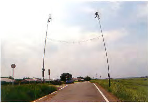
堤防上のハッチョウジメ

フセギ・道切りなどと呼ばれ、地域に疫病や災厄など悪いものが侵入するのを防ぐ行事です。宮元では毎年七月一日、字の境などにハッチョウジメの飾りを設置します。二本の真竹を立て、間に注連縄を張るもので、竹の根本には日向の長井神社の宮司さん（神明社管理者）からいただいたきた塞神のお札を貼ります。俵瀬でも同じようにハッチョウジメを飾りますが、他の地域は短い竹にお札を挟んで立てるのみです。また、かつて七月一日からの七日間はナナバンゲといって、夕方、各家のカイド（敷地から公道へと続く私道）で麦藁の藁束を燃やしました。地域によっては、藁束が燃えてできた灰で地面に境界線を引くことも行われ、疫病の侵入を防ぐ行事であると考えられます。