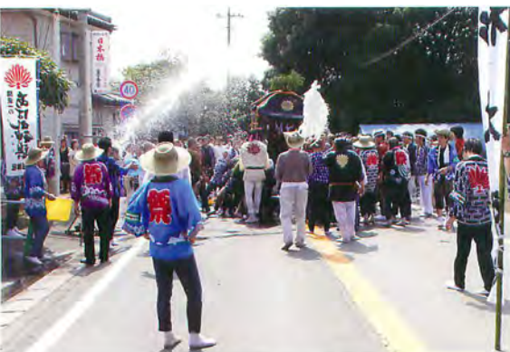
神輿に水をあびせる