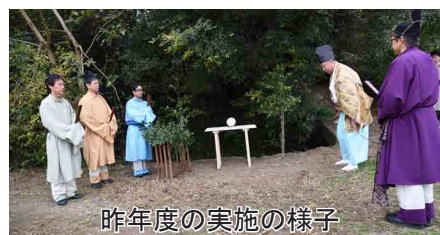
昨年度の実施の様子

※募集期間終了後、11月8日(金)までに応募者 全員の方に参加の可否をお知らせいたします。