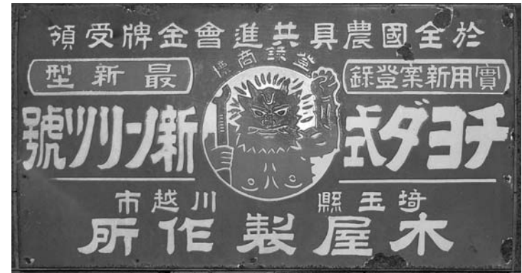
A. 商標 (S=1/4)