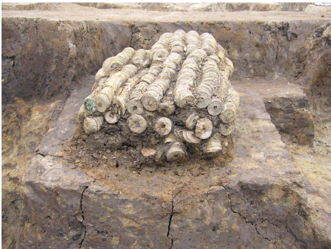
斜め上からの様子