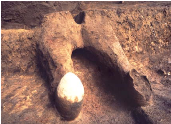
カマドの発掘状況

今回の展示では、遺跡から出土した各種の遺物を手がかりに、当時の人々の生活やムラの様子を解説します。