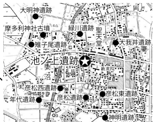
調査地点及び周辺遺跡分布図

竪穴建物跡は、7世紀末～8世紀初頭に属するものが5棟、8世紀前半に属するものが6棟と、検出された18棟の約6割を占め、8世紀後半～9世紀後半に属するものは、3棟と少ない状況です。また、カマドが設置されたか所を見ると、時期で共通した傾向が見られ、7世紀末～8世紀初頭のは北西の向きに、8世紀前半のものは北東の向きに設置されています。なお、8世紀以降は、棟数が少なく、詳細な傾向は不明ですが、9世紀中頃～後半のものは北向きに、9世紀後半のものは北西でもやや北向きに設置されている傾向が見られます。また、竪穴建物跡の分布状況ですが、調査が分譲