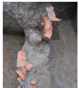
第18号竪穴建物跡遺物出土状況