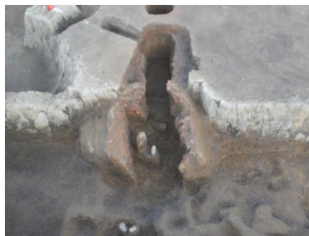
第7号竪穴建物跡カマド