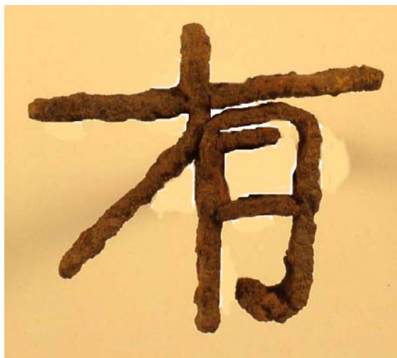
「有」印面最大幅 7.8 cm ・ 最大長 6.7 cm