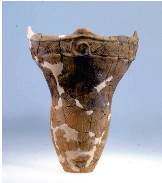
煮炊き(しよくざい) かねつちようり (食材を加熱調理)に使った縄文土器(つか) じょうもんどき (今から約5, 000年~4, 000年前)