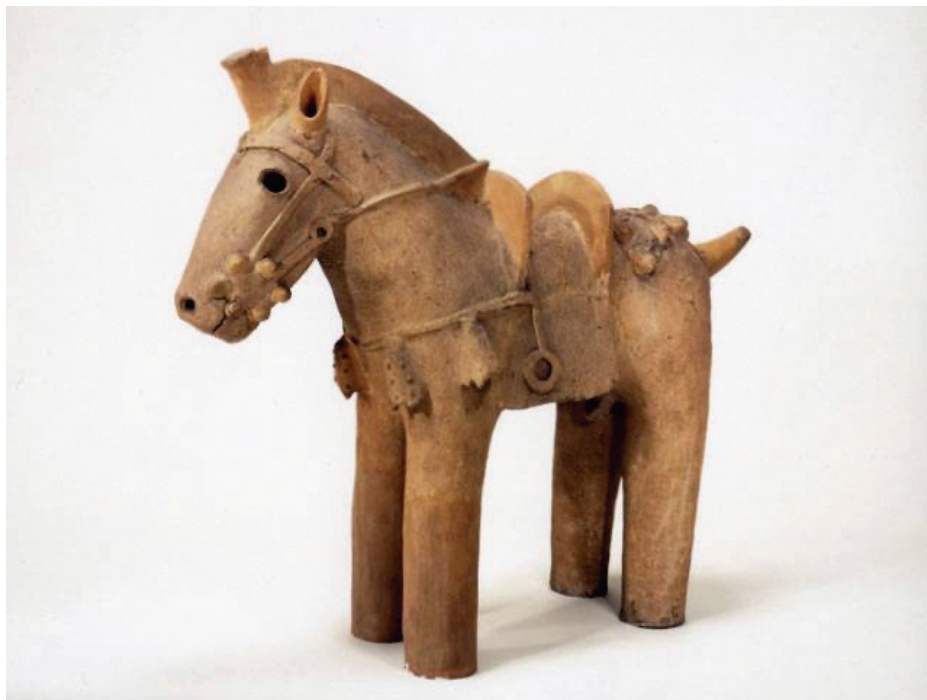
ばく 馬具(馬に乗るための器具や飾り)をつけた馬の埴輪(馬形埴輪)(今から約1,500年~1,450年前)