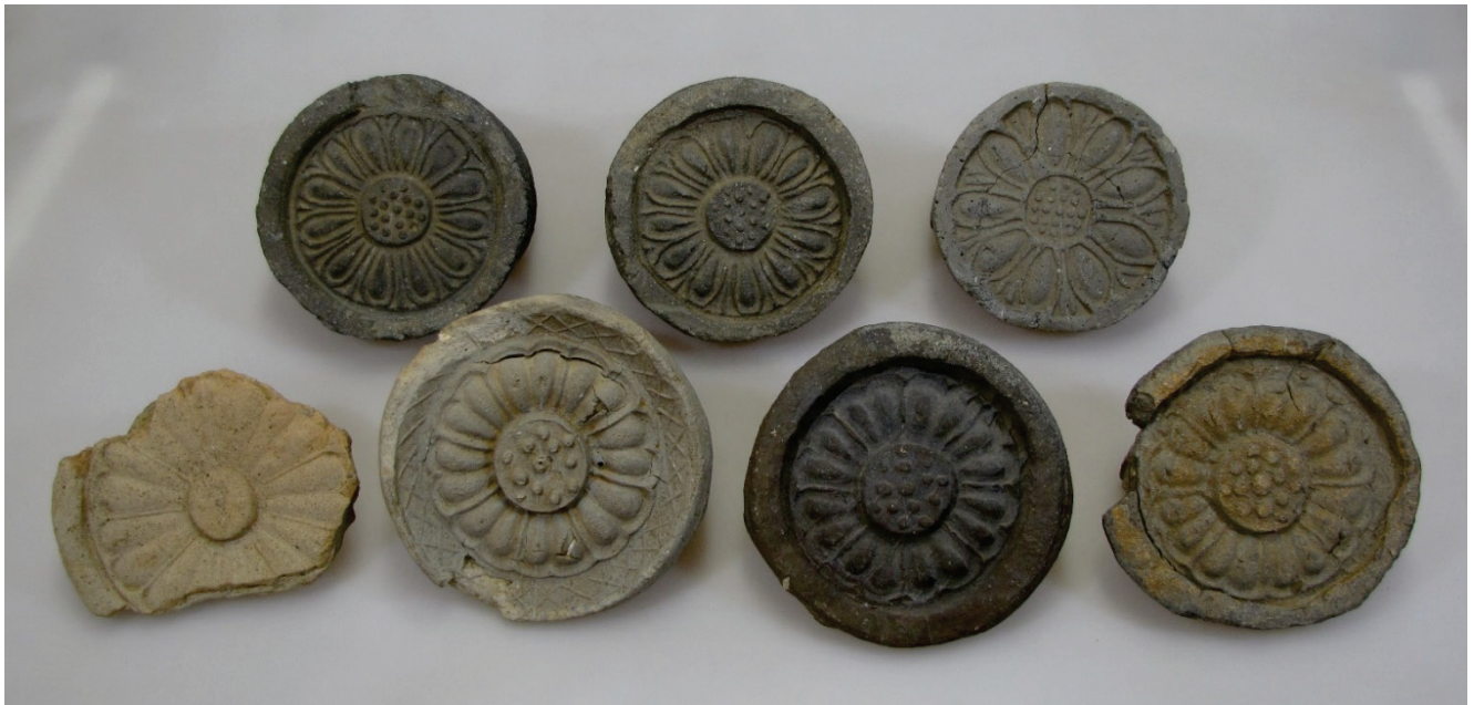
てら やね のきさき お寺の屋根の軒先(先端)に飾られた丸瓦(軒丸瓦) かざ まるがわら のきまるがわら (今から約1,300年~1,225年前)