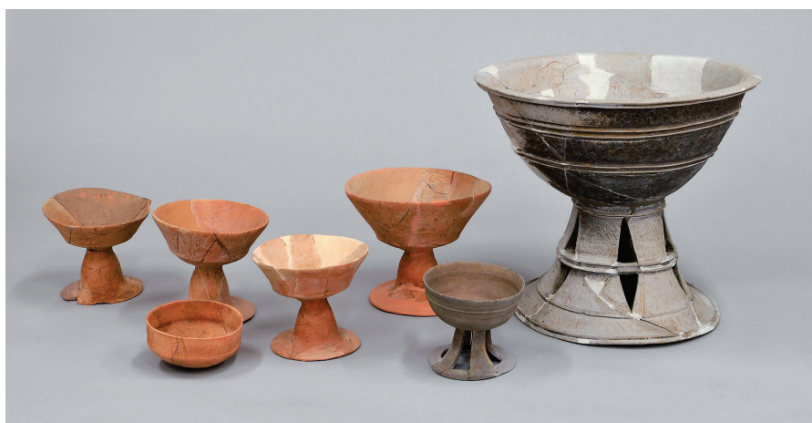
そうしき 葬式のお祭りに まつ 使った つか 土器(赤色のが どき 土師器、灰色のが はじき 須恵器)(今から約1,500年前)