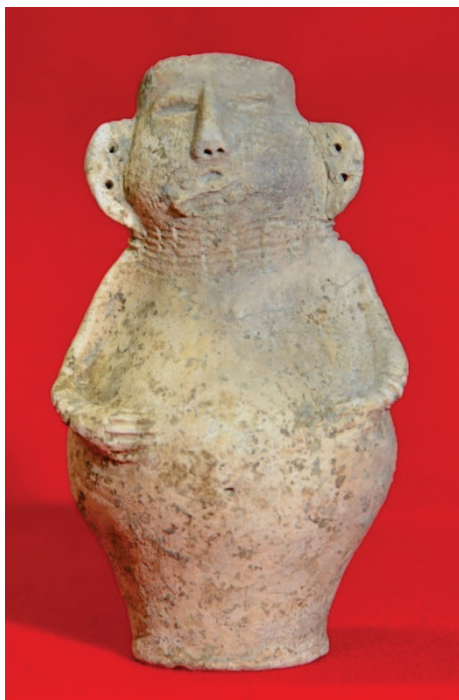
な 亡くなった こども 子供の ほね 骨や は 歯を入れた い 容器(土偶 ようき 形容器)(今から約2,000年前)