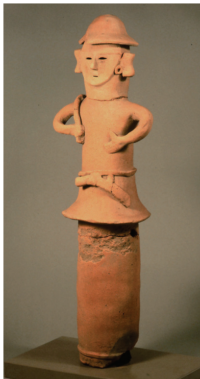
かさをかぶり、くわをかつぎ、こしとうすじょうこうぐのうみんはにわのうふはにわ(今から約1,500年~1,400年前)