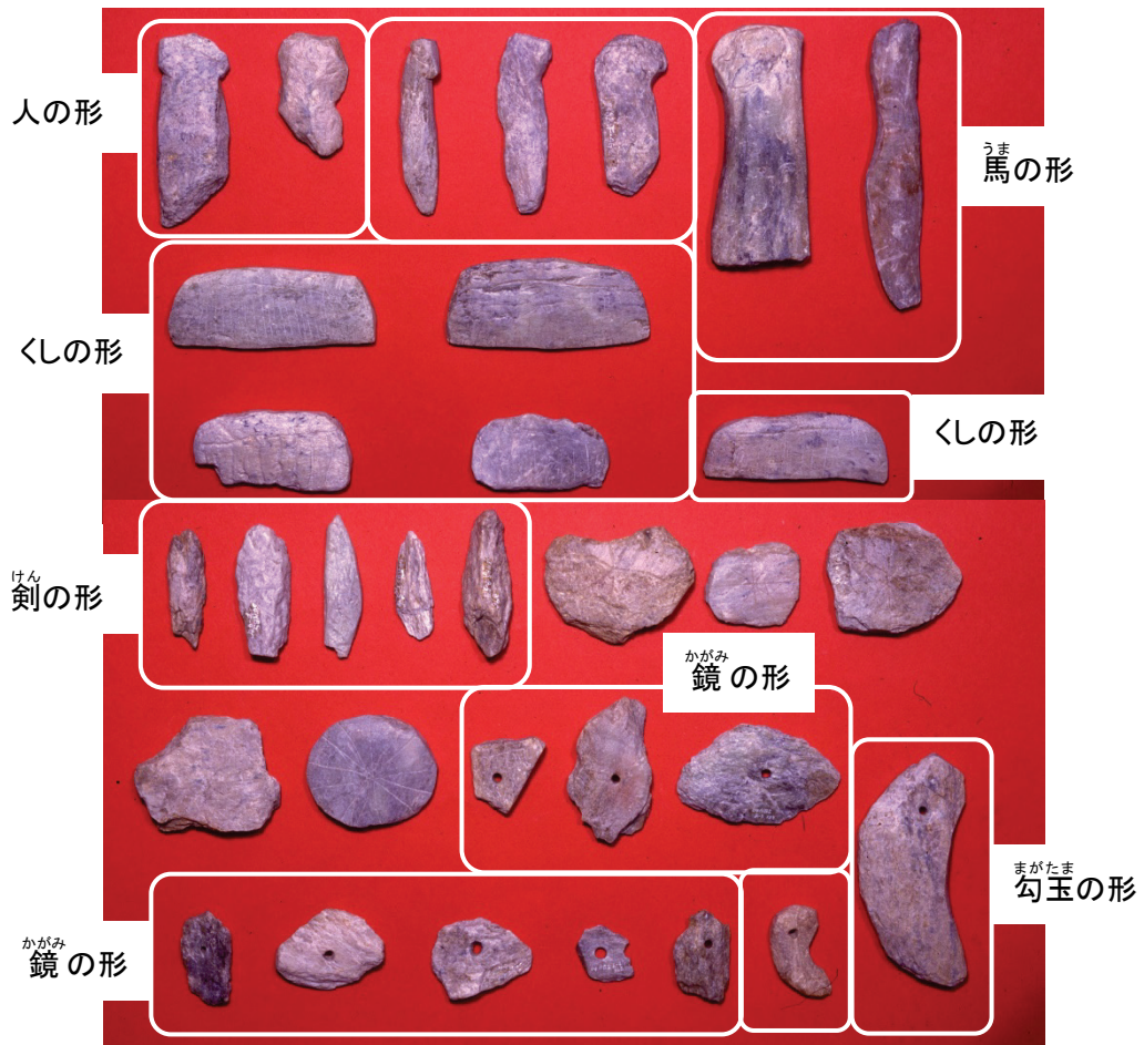
かみさま いの まつ つか 水の神様への祈りのお祭りに使われた石で作った本物の代わりに品(石製模造品)(今から約1,350年~1,300年前)