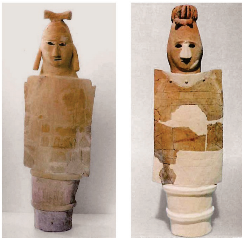
こふん 古墳のまわりに置かれ、 お 古墳をまもるガードマンの ぶじんはにわ たてもちびとはにわ 武人埴輪(盾持人埴輪)(今から約1,500年前)