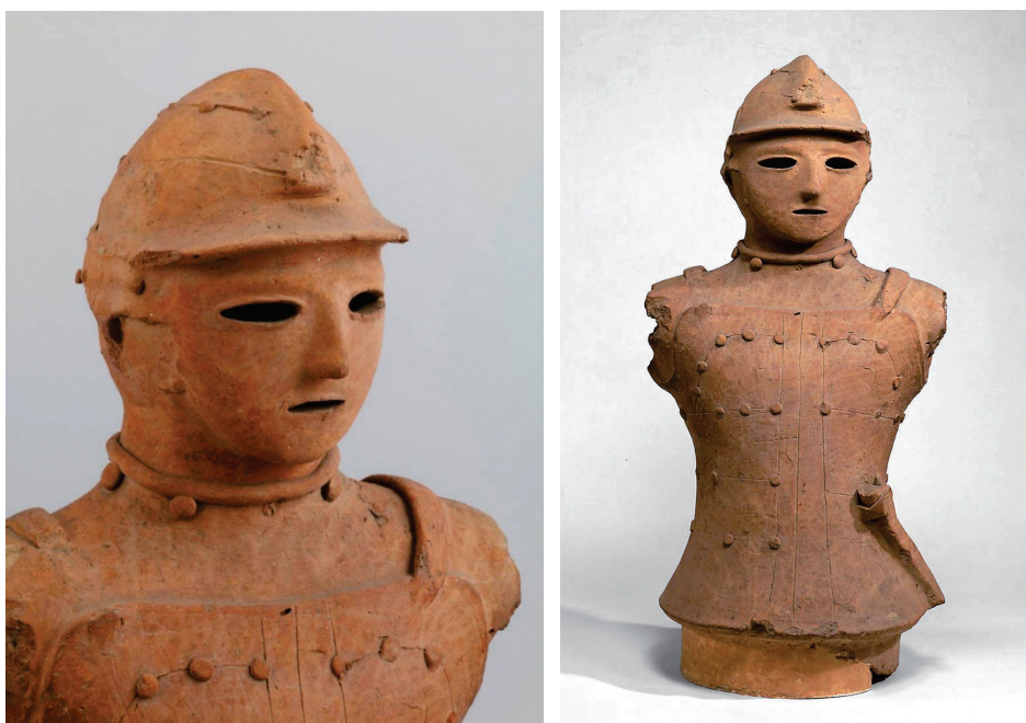
かぶと 冑をかぶり、 よろい たんこう み 鎧(短甲)を身につけた ぶじんはにわ はにわ 武人埴輪(埴輪 ぶそうだんしぞう 武装男子像)(今から約1,500年~1,450年前)