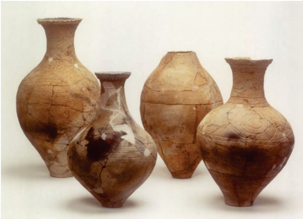
な 亡くなった おとな 大人の ほね 骨を入れた い 弥生土器(今でいう こつぽ 骨壺)(今から約2,000年前)