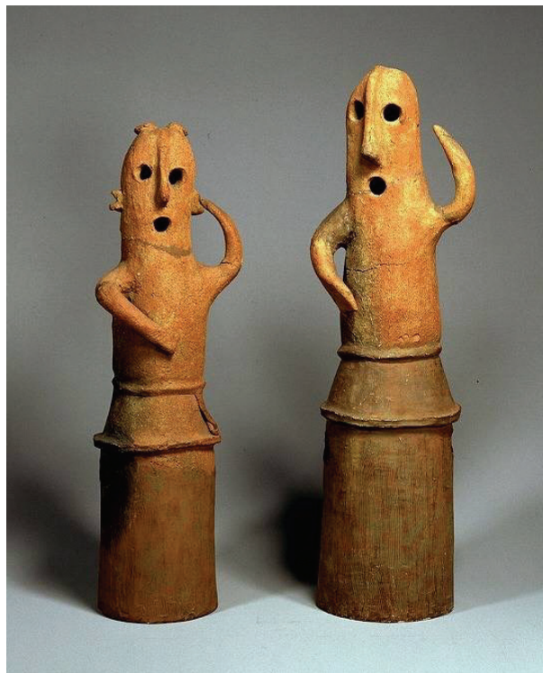
うま 馬の手綱(馬に合図を送るひも)をもち引く馬子の埴輪(埴輪 踊る人々)(今から約1,500年~1,400年前)