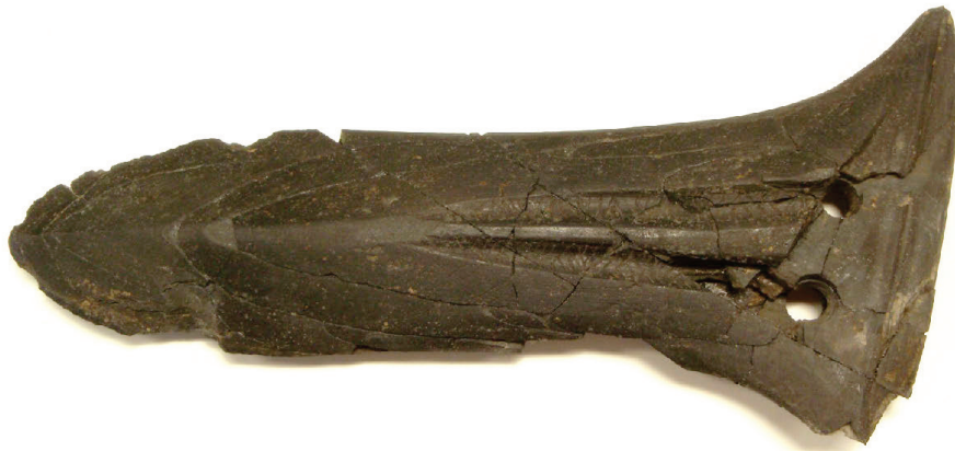
まつ お祭りに つか 使うため石で作った ぶき 武器(石 せつか 戈)(今から約2,000年前)