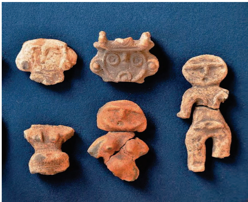
お祭りに使うために土で作った人形(にんぎよう) どぐう (土偶) (今から約3, 500年~3, 000年前)