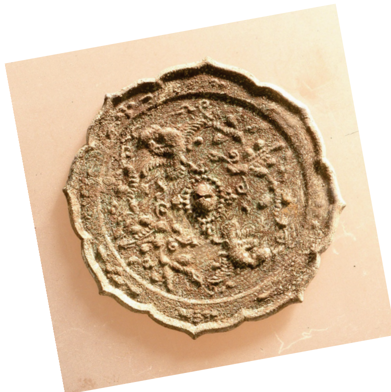
たてあなじゅうきあと いえ 竪穴住居跡(家)にあった鏡(写真は裏の模様側<映す側の反対の面>) (今から約1,000年~950年前)