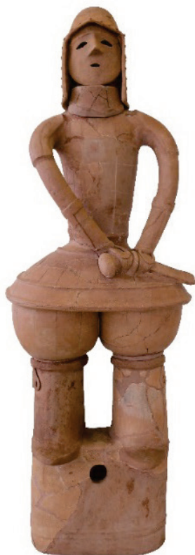
かぶとをかぶり、よろいをつけて、こしにたちを添えたぶじんはにわ(今から約1,450年前)

(こふんじだい) おおざかいこふんぐん 大境古墳群 ・大境南6号墳 (冑山・熊谷地区) 出土